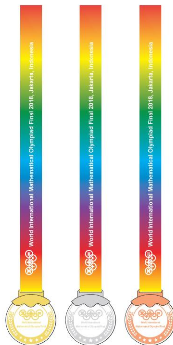
獎牌 --- 金獎 / 銀獎 / 銅獎