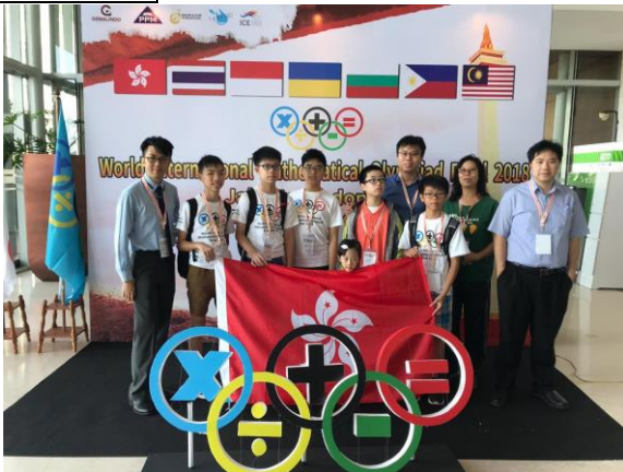
香港代表隊參加於印尼雅加達舉辦 世界國際數學競賽總決賽 2018