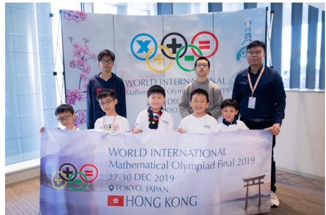
香港代表隊參加於日本東京舉辦 世界國際數學競賽總決賽 2019