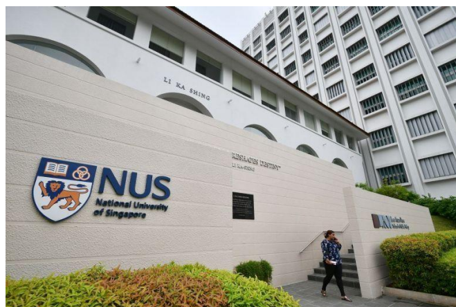
新加坡國立大學校園