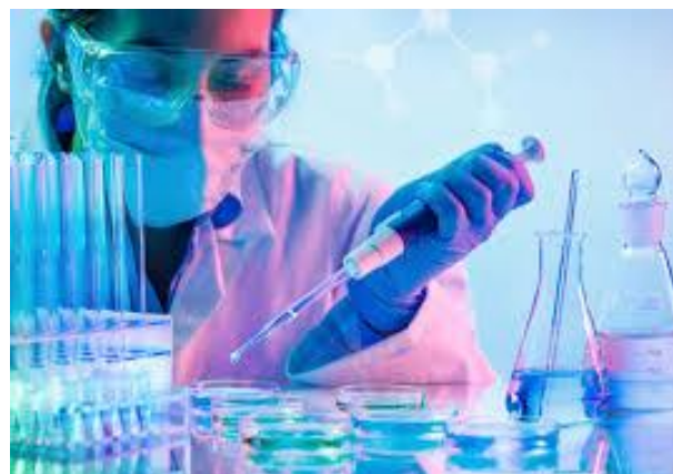
將來如何成為科學家