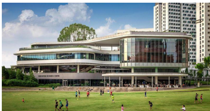
新加坡國立大學全景貌