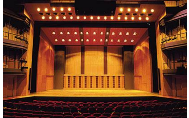
頒獎典禮 Prizing Ceremony