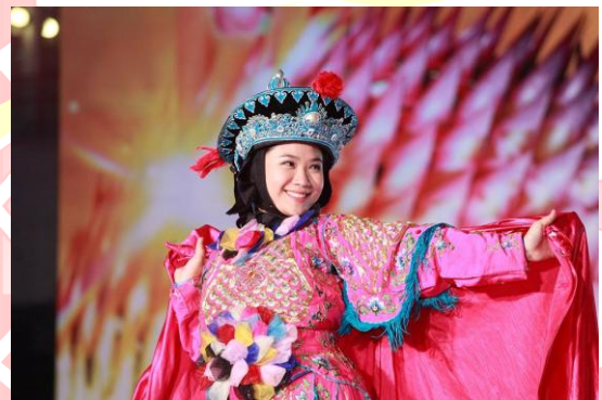
頒獎典禮指定國術 --- 變臉表演