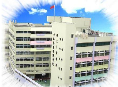
比賽場地 Competition Venue