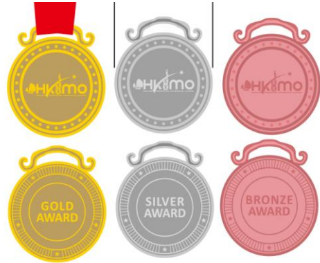
獎牌 --- 金獎 / 銀獎 / 銅獎