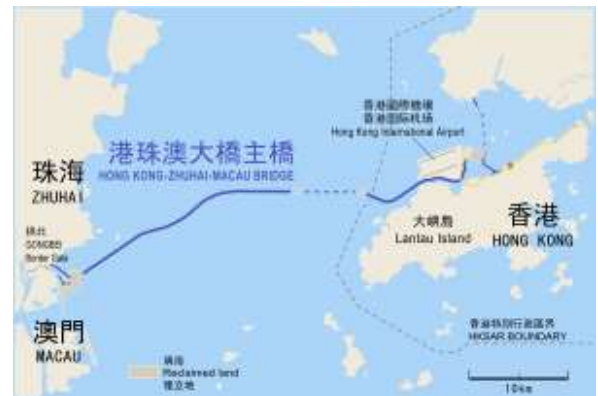
港珠澳大橋路線圖