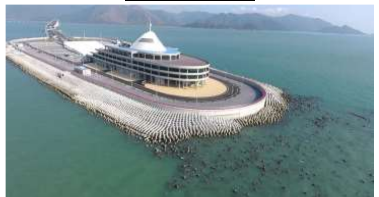
港珠澳大橋人工島