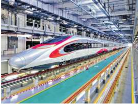
高鐵路香港段已於 2018 年 9 月 23 日正式通車