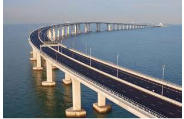
港珠澳大橋已於 2018 年 10 月 24 日正式通車