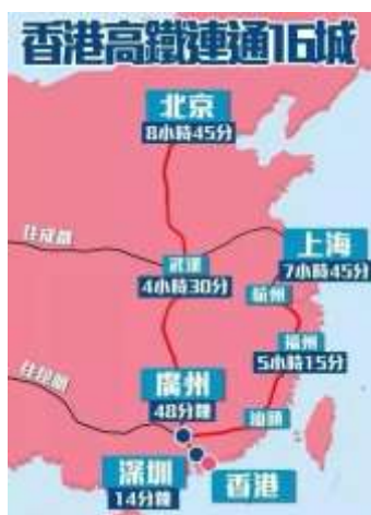
高鐵路貫中國 16 大城市