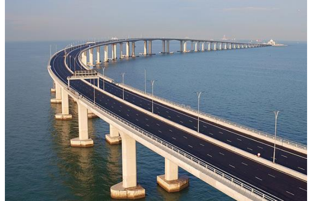
港珠澳大橋已於 2018 年 10 月 24 日正式通車