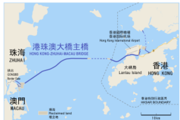
港珠澳大橋路線圖