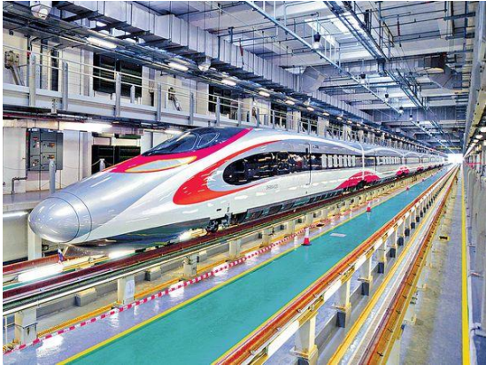
高鐵香港段已於 2018 年 9 月 23 日正式通車