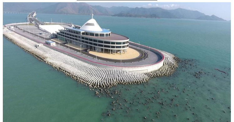
港珠澳大橋人工島