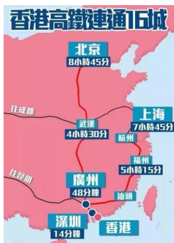
高鐵路貫中國 16 大城市